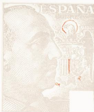
TIPO II B

El dibujo tiene las mismas características que las de los tipos I y II, pero las cifras del valor son completamente diferentes.