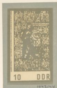
WOMACKA: LA RESISTENCIA. — Walter Womacka, pintor y decorador alemán, nacido en 1925, es el autor de las vidrieras reproducidas en los sellos de esta serie. «La resistencia» o «Lucha ilegal» es el título de la primera. En la parte alta una inscripción viene a decir «Por la libertad y la independencia de todas las patrias».