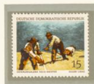
EGGER-LIENZ: CAMPESINOS TRABAJANDO. — Las colecciones de pintura moderna de la Gemäldgalerie de Dresde se ciñen a la figuración realista que antes apuntábamos. Albin Egger-Lienz, pintor alpino nacido en 1868 y muerto en 1926, nos ofrece esta imagen ejemplar de la vida cotidiana.