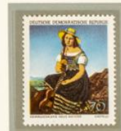
MICHAELIS: MUCHACHA CAMINO DE LA ESCUELA. — Otra de las obras más características del Museo de Arte Moderno de Dresde es esta delicada composición debida al pincel de Paul Michaelis, artista alemán contemporáneo nacido en 1914.