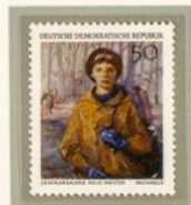
CASTELLI: LA MUCHACHA DE LA GUITARRA. — Obra firmada por Luis Castelli pintor nacido en 1895 y muerto en 1949. Es una de las muestras del estilo neoclásico en el Museo de Arte Moderno de Dresde.