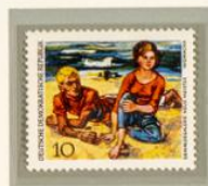
WOMACKA: EN LA PLAYA. — El pintor Walter Womacka, nacido en 1925, es uno de los máximos representantes de la pintura alemana de la era socialista. «En la playa» sigue los cánones de un realismo a ultranza cultivado generalmente, con gran convicción, en todos los países del Este de Europa.