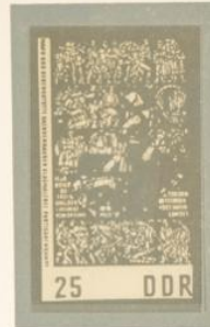
WOMACKA: LA MUERTE DE UN PARTISANO. — El «Museo de la Resistencia» de Sachsenhausen está principalmente orientado contra el fascismo. La inscripción de esta tercera vidriera es todavía más contundente y el personaje caído en la lucha subraya el lenguaje escrito.