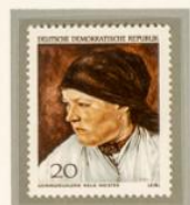
LEIBL: CAMPESINA. — De origen bávaro y nacido en Colonia en 1844, Wilhelm Leibl se formó en la academia de Munich y se estableció durante algún tiempo en París. En esta ciudad se hizo amigo de Gustave Courbet. De regreso a Alemania, Leibl se convirtió en el jefe del realismo. Murió en Würzburg, en 1900.