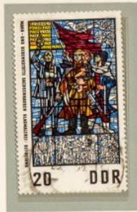
WOMACKA: LA LIBERACIÓN. — El tríptico forma parte de la decoración del «Museo de la resistencia» de Sachsenhausen. Dividida cada una de ellas en veinte rectángulos, estas vidrieras tienen la particularidad de ofrecer el tema central en policromía, mientras que los fondos son monocromos. Esta vez el artista ha grabado como inscripción la palabra «Paz» en varios idiomas.