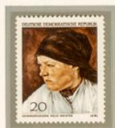
LEIBL: CAMPESINA. — De origen bávaro y nacido en Colonia en 1844, Wilhelm Leibl se formó en la academia de Munich y se estableció durante algún tiempo en París. En esta ciudad se hizo amigo de Gustave Courbet. De regreso a Alemania, Leibl se convirtió en el jefe del realismo. Murió en Würzburg, en 1900.