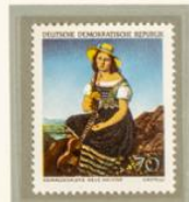
MICHAELIS: MUCHACHA CAMINO DE LA ESCUELA. — Otra de las obras más características del Museo de Arte Moderno de Dresde es esta delicada composición debida al pincel de Paul Michaelis, artista alemán contemporáneo nacido en 1914.