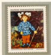
VENTURELLI: LA HIJA DEL PINTOR. — José Venturelli es un pintor chileno contemporáneo que ha residido una larga temporada en Alemania. Este retrato de la hija del pintor, vestida con traje típico, forma parte de la colección del Museo de Arte Moderno de Dresde.