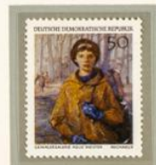
CASTELLÍ: LA MUCHACHA DE LA GUITARRA. — Obra firmada por Luis Castellí pintor nacido en 1895 y muerto en 1949. Es una de las muestras del estilo neoclásico en el Museo de Arte Moderno de Dresde.