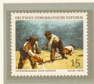
EGGER-LIENZ: CAMPESINOS TRABAJANDO. — Las colecciones de pintura moderna de la Gemäldgalerie de Dresde se ciñen a la figuración realista que antes apuntábamos. Albin Egger-Lienz, pintor alpino nacido en 1868 y muerto en 1926, nos ofrece esta imagen ejemplar de la vida cotidiana.