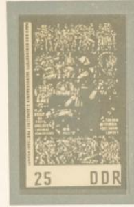
WOMACKA: LA MUERTE DE UN PARTISANO. — El «Museo de la Resistencia» de Sachsenhausen está principalmente orientado contra el fascismo. La inscripción de esta tercera vidriera es todavía más contundente y el personaje caído en la lucha subraya el lenguaje escrito.