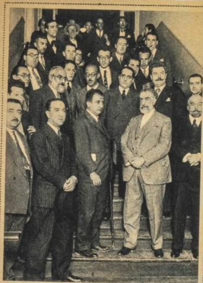
Madrid.—El comandante don Ramón Franco, con los miembros de la Junta del Ateneo, después de la conferencia dada por el famoso aviador acerca de «Los deportados en Villa Cisneros»