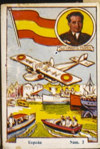
El comandante Franco, con el aeroplano Rada, al llegar a Bilbao, donde fueron recibidos por los señores de la ciudad.