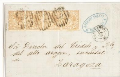
1868 (22 de Abril). Sobrescrito de Barcelona a Zaragoza (ESPAÑA). Franqueado con una tira de cuatro sellos de 50 milésimas de escudo, para cuatro portes . Matasellos Parrilla "2" de Barcelona. En el frente hay un fechador de origen y al dorso de llegada.