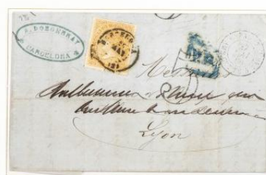
1869 (25 de Mayo). Carta de Barcelona a Lyon (FRANCIA), franqueada con 12 Cuartos, para un porte. Marcas P.D. y "5" y fechador ambulante, de CETTE a PAU. Matasellos fechador de Barcelona, Tipo II.