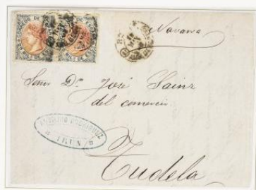
1868 (18 de Mayo). Sobrescrito de Irún a Tudela. Franqueado con una pareja de 25 milésimas, para un porte . Matasellos NORTE/AMB DESCTE/1°. Se repite en el frente.