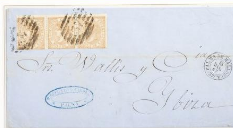
1867 (15 de Diciembre). Sobrescrito de Palma de Mallorca a Ibiza (ESPAÑA). Franqueado con una tira de tres de 50 milésimas de escudo, para un triple porte . Matasellos Parrilla "37" de Palma. El frente, fechador de origen Tipo II.