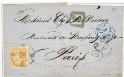
1869. Envuelta de La Junquera a París (FRANCIA). Franqueada con un 12 cuartos naranja, para un porte a Francia. Matasellos Rueda de Carretero "61". Marcas "P.D." y "5" de porteo francés.