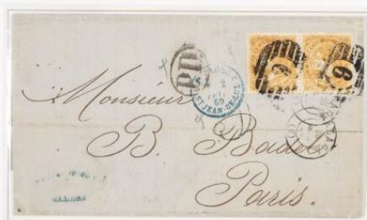
1869 (29 Febrero). Sobrescrito de Málaga a París (FRANCIA). Franqueado con una pareja del 12 Cuartos naranja, para un doble porte . Matasellos Parrilla con cifra "6" de Málaga y fechador de origen. En el frente, tránsito por S. Jean de Luz y marcas P.D. y S°. Al dorso, llegada el día 30.