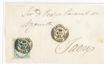
1867 (30 Nov). Media envuelta de Andújar a Jaén (ESPAÑA). Franqueada con un sello de 10 céntimos, para un doble porte . Matasellos fechador, tipo II y en el frente, se repite la marca.