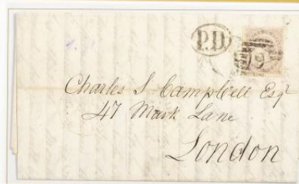
1868. Carta de Málaga a London (INGLATERRA). Franqueada con un solo sello de 20 cts de escudo para satisfacer la tarifa de un porte a Inglaterra. Matasellos parrilla con cifra "6" de Málaga y fechador Tipo II, ambos sobre el sello.