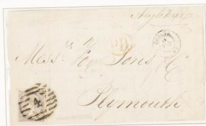
1867 (12 de Julio). Sobrescrito de Coruña a Plymouth (INGLATERRA). Franqueo de 20 Centésimas de Escudo, para un porte . Matasellos Parrilla con cifra "4" de Coruña. En el frente, fechador de origen Tipo II y marca "P.D.". Al dorso, el fechador de llegada.