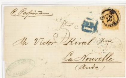
9 Julio 1869. Carta de Barcelona a La Nouvelle (FRANCIA). Franqueo de 12 Cuartos y matasellos fechador. También lleva la marca "5", en negro.

º (1867ca). Interesante conjunto de sellos usados y cartas circuladas de las emisiones de Isabel II de 1867 y 1868, incluye varios sellos de 19 cuartos rosa y castaño, un 2 cuartos de 1867 nuevo, varias cartas dirigidas a Francia y Gran Bretaña franqueadas con sellos de 20 cts y 12 cuartos, una dirigida a Italia con sello de 100 mils verde, franqueos múltiples nacionales y bloques. IMPRESCINDIBLE EXAMINAR.