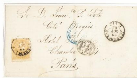
1868 (20 Octubre). Carta de Jerez de la Frontera a París. Franqueo de 12 cuartos para un porte sencillo. Matasellos fecha de Jerez, Tipo I.