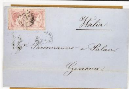
1876 (8 de Enero). Sobrescrito de Begur a Génova (ITALIA). Franqueada con dos sellos de 25 céntimos, para un doble porte . Matasellos fechador de la Bisbal, que se repite en el frente. Al dorso, tránsito por la Junquera.