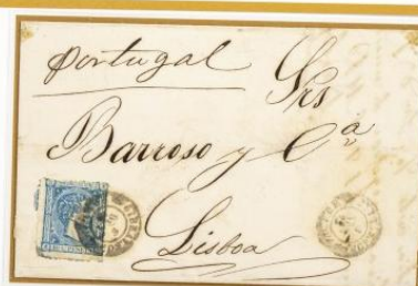
1875 (5 de Octubre). Sobrescrito fechado en Castillejos y dirigido a Lisboa (PORTUGAL). Franqueado con un sello de 10 céntimos, para un porte . Matasellos fechador de Gibralfaro. En el frente, se repite el fechador. Al dorso, los fechadores de tránsito por Faro y de llegada a Lisboa, el día 8 de Octubre.