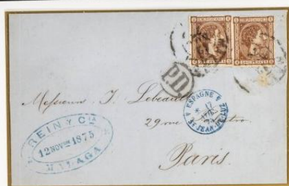
1875 (12 de Noviembre). Sobrescrito de Málaga a París (FRANCIA). Franqueado con 40 céntimos, dos sellos, para un doble porte y un peso de 20 gramos. Matasellos fechador de Málaga. En el frente, tránsito por S. Jean de Luz y marca "P.D." (pago hasta destino).

º 1875. Interesante conjunto de sellos y cartas circuladas de la emisión de Alfonso XII de 1875 destacando dos cartas a Francia (una de doble porte y otra con "A" de Haro), dos a Portugal, una a Argentina, tres a Génova, una a Dinamarca, un sello de 1 pts con matasello extranjero Ancla y un telegrama de Filipinas con sellos de diferentes emisiones (algunos montados en fichas de subasta). IMPRESCINDIBLE EXAMINAR.