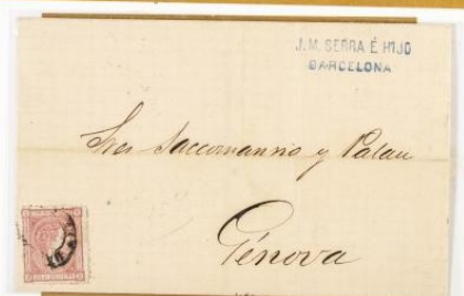
1876 (6 de Abril). Envuelta de sobrescrito de Barcelona a Génova (ITALIA). Matasellos ovalado "BARCELONA/FRANCO". Al dorso, tránsito por la Junquera y el fechador de llegada. Franqueada con un sello de 25 céntimos, para un porte .