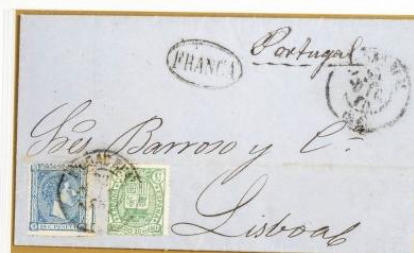
1875 (22 de Diciembre). Sobrescrito de Ciudad Real a Lisboa (PORTUGAL). Franqueado con un sello de 10 céntimos, para un porte , y 5 céntimos de Impuesto de Guerra, no aplicable para las cartas circuladas al extranjero. Matasellos fechador de origen. En el frente, la marca "FRANCA" dentro de un óvalo. Al dorso, el fechador de llegada.