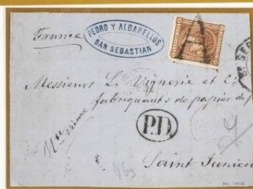
1875. Frontal de S. Sebastián a S. Junien (FRANCIA). Franqueado con 40 céntimos, para un porte . Matasellos prefilatélico "A" de abono, de uso muy tardío. En el frente, fechador de origen y marca "P.D."