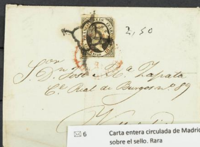
✉ 6 Carta entera circulada de Madrid a Mérida con Baeza "Madrid" y "Araña" sobre el sello. Rara