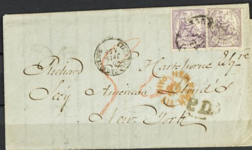
✉ 148(2) Carta circ. de Málaga a New York, vía Bélgica. Diversas marcas de tránsito y llegada. Rara pieza pese 1 sello estar sustituido.