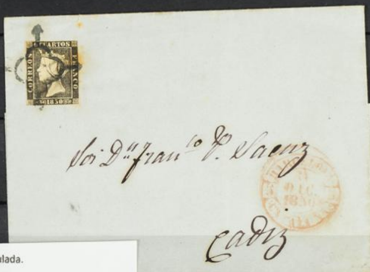
✉ 1A 1850. Carta circulada.