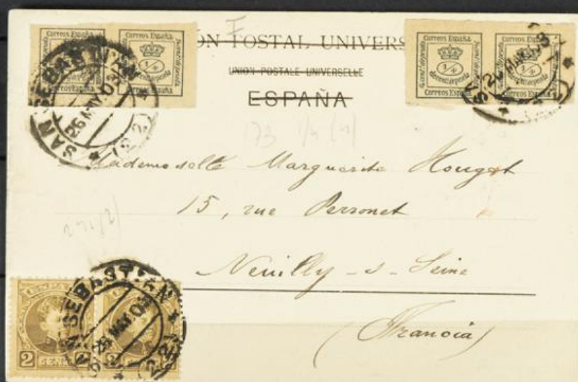
TP 173(4 cuartillos) 1903. Preciosa postal "San Sebastián - Alderdi-Eder y el Casino" + 241(2) circ. Mat "San Sebastián 26/May./03" a Francia.