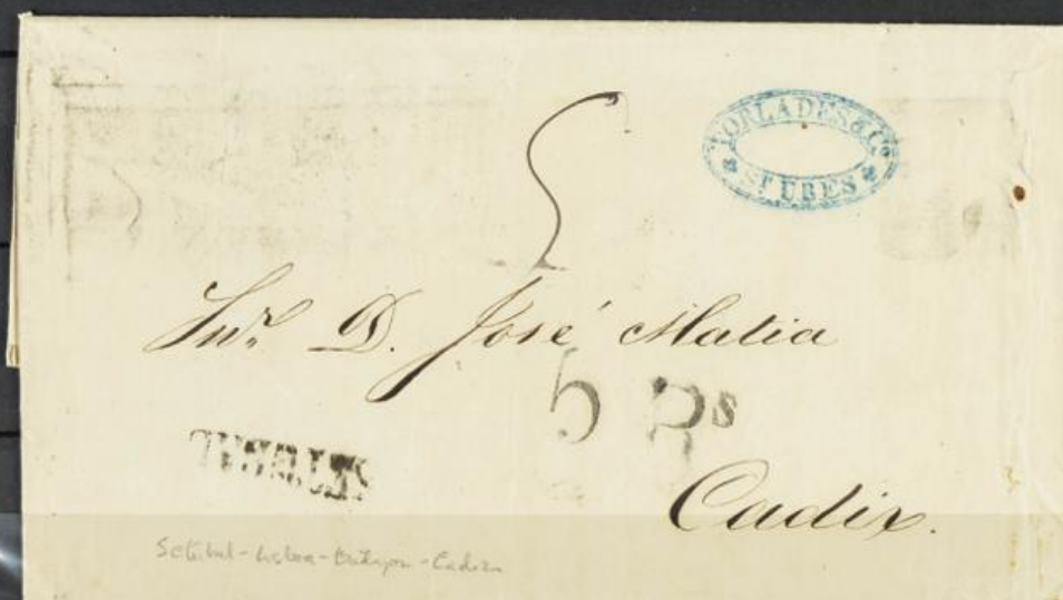
Lote 10 ✉ Carta fechada en "Setúbal 16/11/60" con marca lineal "Setúbal" tránsito en Lisboa + tránsito "Badajoz" + porteo impreso "SR"