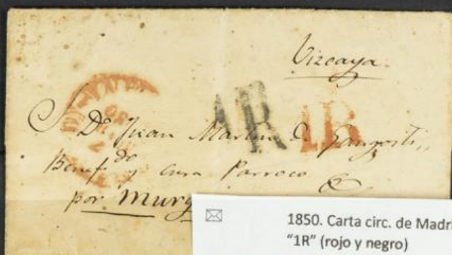
✉ 1850. Carta circ. de Madrid a Murguía (Vizcaya) con doble marca de porteo "1R" (rojo y negro)