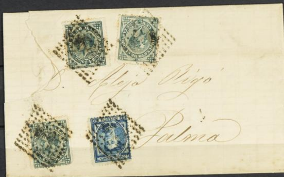
✉ 175+183(3) 1877. Carta de Barcelona a Palma.