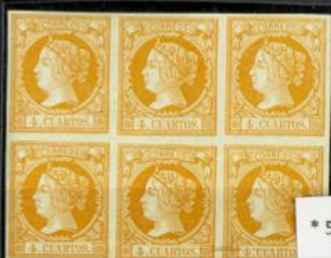
* 52 Bl. 6 4 cuartos. Bloque de 6. Amplios márgenes y color intenso. Al dorso cartón adherido en la goma producido doblez de un sello.