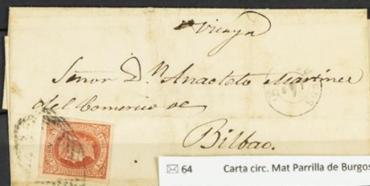
64 Carta circ. Mat Parrilla de Burgos.