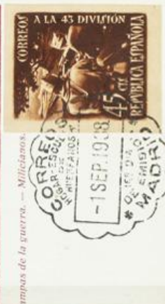
Lote 26 TM 788A Tarjeta Máxima primer día.