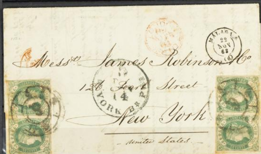
62(4) 1863. Málaga a New York circ. 2 parejas vía Londres y tasada a la Llegada 5ctvos. Doble de archivo que no afecta a los sellos.