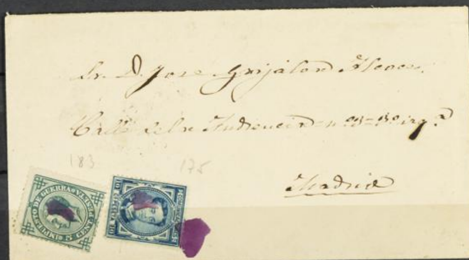
✉ 175+183 Carta circ. a Madrid matasellada a pincel con tinta.