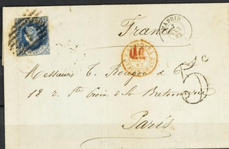
✉ 59 1863. Carta circ. a Paris Mat Parrilla con cifra "1" + diferentes porteos Y tránsitos. Interior membrete publicitario.