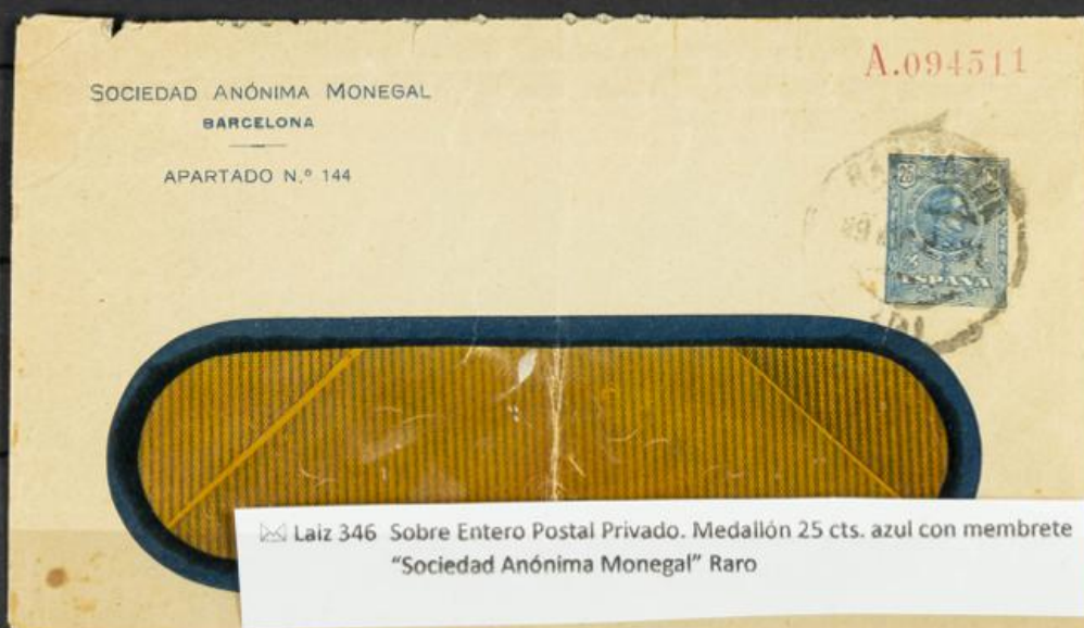
Laiz 346 Sobre Entero Postal Privado. Medallón 25 cts. azul con membrete "Sociedad Anónima Monegal" Raro