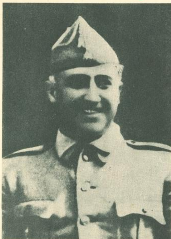
Excmo. Sr. General D. Francisco Franco Bahamonde, Jefe del Gobierno del Estado Español y Generalísimo del Ejército de Operaciones.