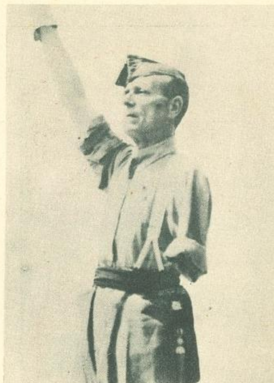
Excmo. Sr. General D. José Millán Astray, Fundador de la Legión y mutilado de guerra.