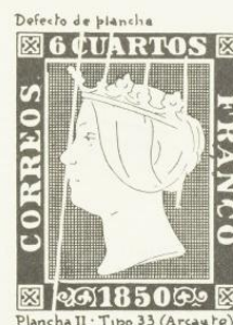
Plancha II: Tipo 33 (Arcaute)

También se producen por desgaste de la plancha o defectos accidentales. En las impresiones tipográficas es donde más se observan. Los defectos de impresión, reporte y principalmente los retoques dan una plus-valía al sello que los poseen.