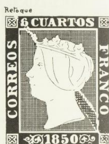
Plancha I: Tipo 11