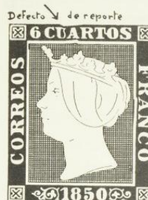
Plancha II: Tipo 19 (Arcaute)

Consisten en defectos en la piedra litográfica corregidos por los impresores. Son muy raros. Sólo se conocen unos seis diferentes en el valor 6 cuartos.