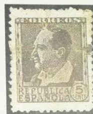
Falso Postal de 1936

pruebas, que tratábase de la G.N.T.-F.A.I.) decidió franquear sus impresos de propaganda mediante sellos de 5 céntimos, efígie de Blasco Ibáñez emisión de 1934, producidos en sus propios talleres de imprenta (figs. 11 y 12); los objetivos enlazaban perfectamente con el ideario de la organización: por un lado no estar sometidos a las tasas impuestas por un modelo de Estado al que se despreciaba y al que, en alguna manera, se deseaba destruir y por otro reducir a niveles de casi gratuidad los costos del transporte de todo el correo impreso que se fuera capaz de producir. No resistimos la tentación de exclamar el consabido «si non é vero é ben trobado» aunque en nuestro fuero interno nos inclinamos por el «verro» ya que los pocos ejemplares usados que hemos visto, no más de ocho, están todos doblados y con la peculiar mancha de grasa producida por el pincel usado para inutilizar los sellos puestos de esta forma en los paquetes de impresos.