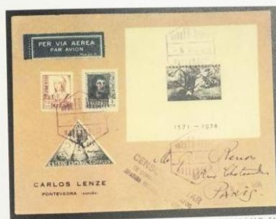
Propiedad del Dr. Schier

»Las hojitas fueron vendidas oficialmente a partir de 5 de diciembre de 1938, con una sobretasa de 5 pesetas por hojita y su validez duró hasta el 31 de diciembre de 1938. Sin embargo, la mayor parte de la tirada y casi todas las hojitas sin dente no llegaron a las ventanillas españolas desde la imprenta holandesa, más bien fueron vendidas en el extranjero por los comerciantes que habían sugerido la emisión. En vez del precio de Correos de 21,90 pesetas los negociantes pidieron ya en el momento de su emisión 150-200 pesetas para las 4 hojitas.