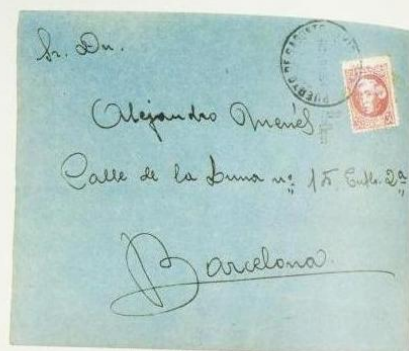
Carta circulada con un Falso Postal de 1935

por el correo. Pese a nuestras investigaciones no hemos logrado averiguar si esta falsificación, que en realidad es bastante burda e identificable a simple vista, fue localizada por la Administración; en el supuesto de no haberlo sido cabe la explicación de que realmente no fue difundida a gran escala, citándose a unos relativamente pocos ejemplares dentro del total de sellos auténticos producidos por el Estado.