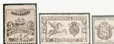
Local Urgente Oficial