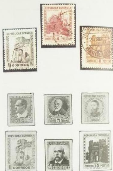
Pruebas de color negro de varios valores de la serie

La pre- fundo de su zido a Las di- vencio- Histori- cas ci- gran p- mos a que sa- ciones de al profun- como errone cuerpo ello or color nal de Nuest- es mu- vacío tética nista respo- dudas