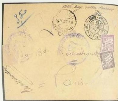
Carta a Franco circulada sin sellos, en los ruidos de Tera franco

«Orden del Ministerio de Hacienda de 25 de febrero de 1939. «Ilmo. Sr.: En virtud de lo dispuesto por Orden de 25 de abril de 1938 se ha realizado la emisión de tres nuevas clases de sellos especiales destinados al percibo de los sobreportes de la correspondencia que circule por vía aérea de colores naranja, verde y azul acero de 20 céntimos y 2 y 4 pesetas respectivamente y tamaño, dibujo e inscripciones iguales a los de los sellos de 25, 35 y 50 céntimos y 1 peseta cuya circulación fue autorizada por Ordenes de 1 de febrero y 12 de enero últimos.