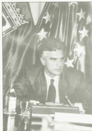
Luis Egusquiza Manchado Director General del Organismo Autónomo Correos y Telégrafos

Gráficas Alcor, S. Coop. Ctra. Logroño, Km. 6,600 Teléfono: (976) 34 75 54 50011 - ZARAGOZA