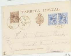
1895. 7 febrero. San Roque, Cádiz, a Roma Franqueo 5 c. + 5 c. azúl. Pelón