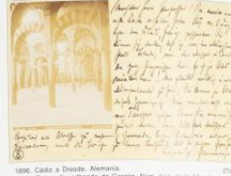
1896. Cádiz a Dresde, Alemania. Fotografía adherida de Garzón, Num. 514, de la Alhambra de Granada