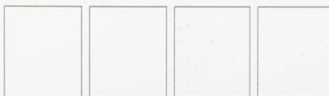
Ensayo-Prueba de tiraje

Doble estampación una invertida con relación a la otra