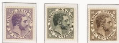
Cambios de color

Dibujo con el busto de su Majestad el Rey hacia la izquierda dentro de un ovalo con la inscripción timbre móvil 1884 en la mitad superior de éste y el valor y el valor en céntimos en la inferior. En los ángulos los emblemas del antiguo Reino de Castilla. Grabador Juliá. Impreso sobre papel blanco. Dentado 14.