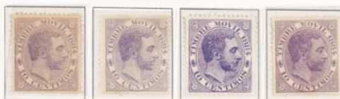
Con la fecha legible