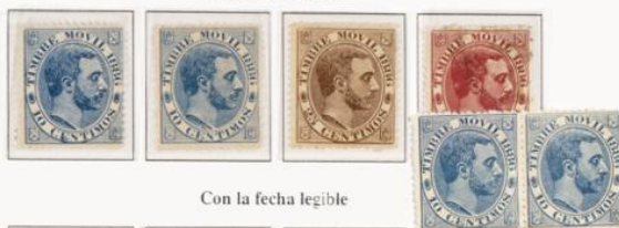
Con la fecha legible