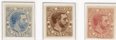
Cambios de color

Dibujo con el busto de su Majestad el Rey hacia la izquierda dentro de un ovalo con la inscripción timbre móvil 1886 en la mitad superior de éste y el valor y el valor en céntimos en la inferior. En los ángulos los emblemas del antiguo Reino de Castilla. Grabador Juliá. Impreso sobre papel blanco. Dentado 14.