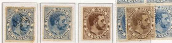
Utilizados en correo