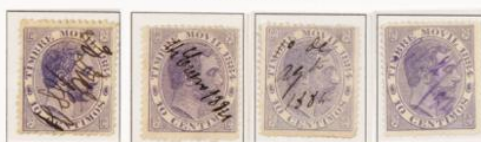
Utilizados en correo