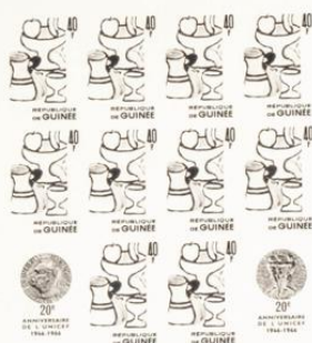
20 e ANNIVERSAIRE DE L'UNICEF-1946-1966