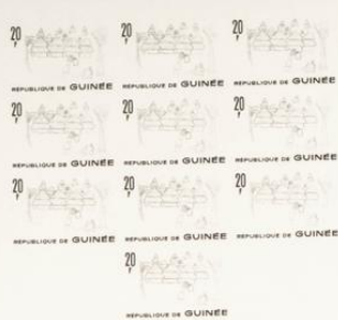
20 e ANNIVERSAIRE DE L'UNICEF-1946-1966