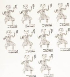
20 e ANNIVERSAIRE DE L'UNICEF-1946-1966