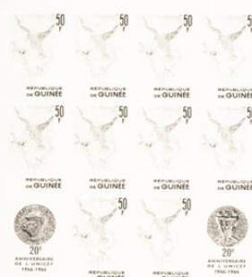
20 e ANNIVERSAIRE DE L'UNICEF-1946-1966