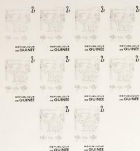
20 e ANNIVERSAIRE DE L'UNICEF-1946-1966