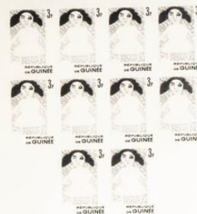
20 e ANNIVERSAIRE DE L'UNICEF-1946-1966