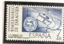
Plano de la ciudad romana