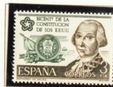
Bernardo de Gálvez