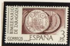
Reverso de moneda, César Augusta