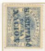
25 Milésimas de Escudo