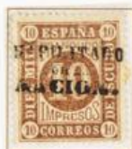
10 Milésimas de Escudo