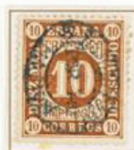
10 milésimas de Escudo