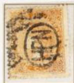
1/4 Cuartos Matasellos Parrilla