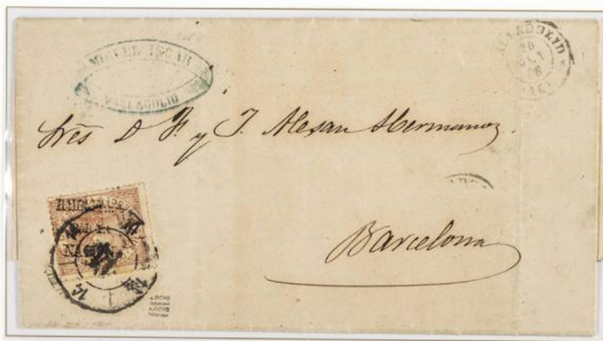
1868 (20 de Octubre). Sobrescrito de Valladolid a Barcelona (ESPAÑA). Franqueado con 50 milésimas de la emisión de Julio de 1867, con sobreimpresión vertical Habilitado por la Nación , original de Valladolid. Matasellos Rueda de Carreta "14" y fechador en el frente.