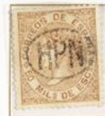
50 Milésimas de Escudo