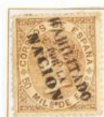
50 Milésimas de Escudo