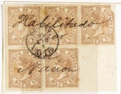
50 Milésimas. Sobre fragmento. Manuscrito "Habilitado por la Nación". GLJON/OVIEDO.