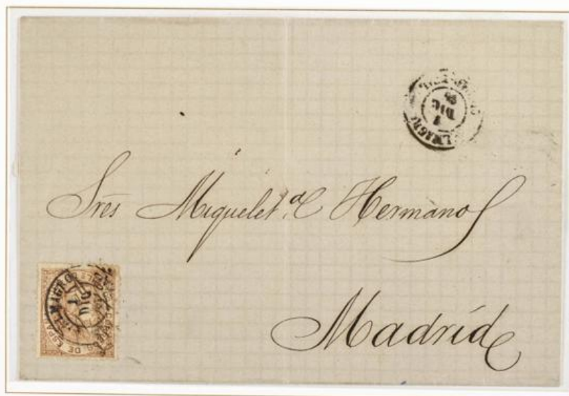
1868 (1 de Diciembre). Envuelta de sobrescrito de Almagro a Madrid (ESPAÑA). Franqueado con 50 milésimas de Escudo para un porte . El sello está invertido y lleva la habilitación manuscrita. Matasellos fechador de origen. Sobre el frente, se repite el fechador y, al dorso, el de llegada a Madrid.