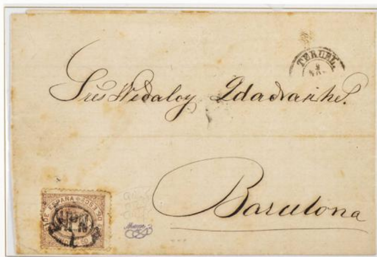
1868 (2 de Noviembre). Sobrescrito de Teruel a Barcelona (ESPAÑA). Franqueado con un sello de 50 milésimas para un porte . El sello lleva la sobreimpresión H.P.N. dentro de un óvalo. Matasellos Rueda de Carreta "47" de Teruel. En el frente fechador de origen y al dorso, el de llegada. (Marquilla "Monge").