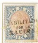
25 Milésimas de Escudo