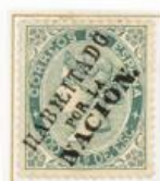
200 Milésimas de Escudo