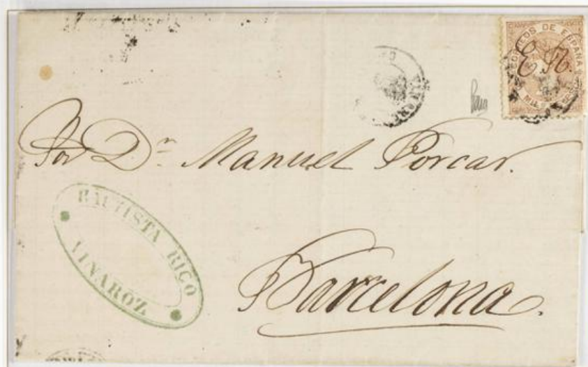
1868 (10 de Octubre). Sobre de carta de Vinaroz a Barcelona (ESPAÑA). Franqueada con un sello de 50 Milésimas de Escudo (Emisión de Julio de 1867), para un porte . El sello lleva la inscripción manuserita "E.R" (Ex Reina). Matasellos VINAROSZ/CASTELLÓN. En el frente hay el fechador de Vinaroz, junto a la firma de Graus y al dorso, el de llegada a Jerez.