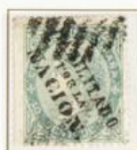
10 Cts de E