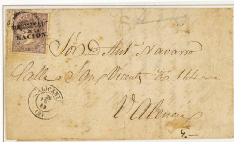
1869 (26 de Julio). Sobrescrito de Alicante a Valencia (ESPAÑA). Franqueado con 50 milésimas para un porte . El sello lleva sobreimpreso "Habilitado por la Nación". Matasellos fechador de origen.