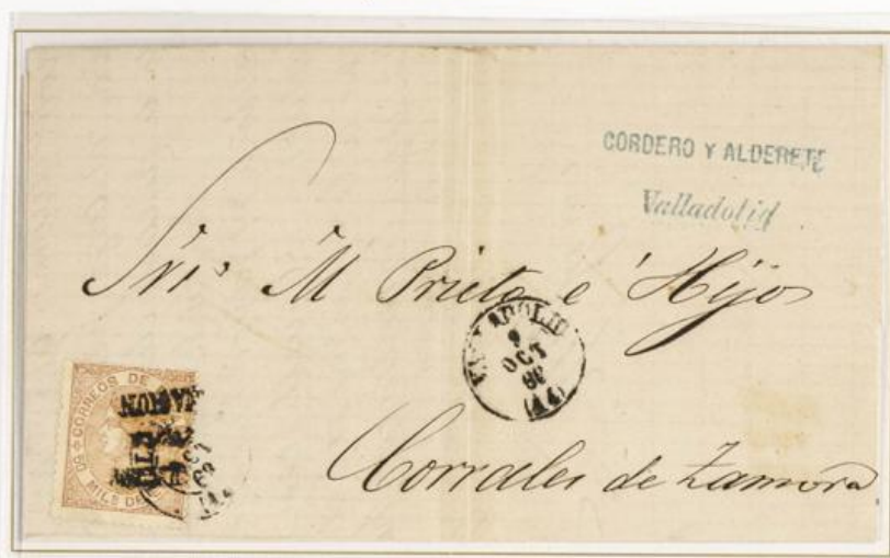
1868 (8 de Octubre). Sobrescrito de Valladolid a Corrales de Zamora (ESPAÑA). Franqueado con 50 milésimas de E., castaño amarillente, con la sobreimpresión Habilitado por la Nación , Tipo I, original de Valladolid, para un porte. Matasellos fechador de origen, que se repite en el frente.

Isabel II Habilitados por la Nación Sobreimpresión de Valladolid