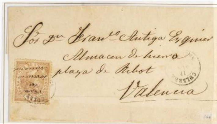
1868 (16 de Octubre). Sobrescrito de un porte de Tabernas a Valencia (ESPAÑA). Franqueado con un sello de 50 milésimas de Escudo, para un porte . Sobre el sello hay manuscrita la alusión antimonárquica "Viva la soberanía Nacional". Matasellos fechador CULLERA/VALENCIA.