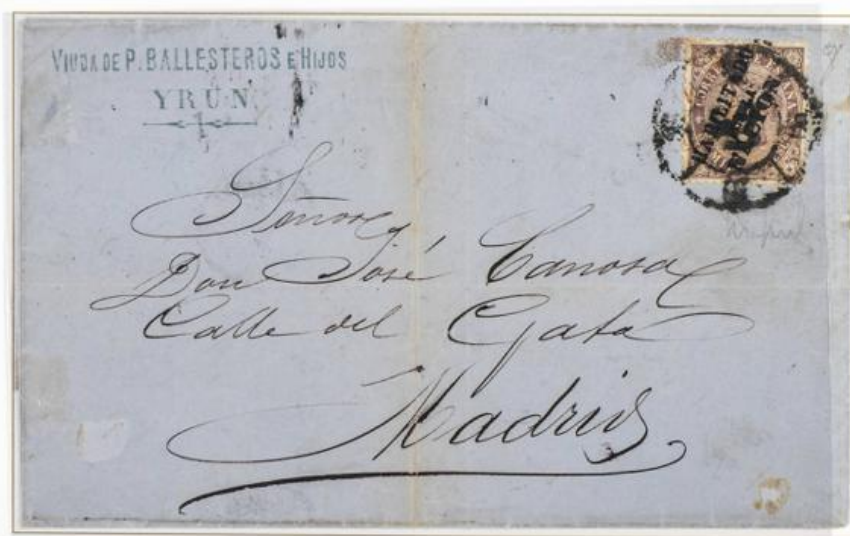
1869 (9 Agosto) y (29 Febrero). Dos cartas de Irún a Madrid (ESPAÑA). Franqueadas con 50 milésimas, para un porte y un peso de hasta 10 gramos. Los sellos llevan sobrecarga de tipo general y la carta de arriba sobrecarga doble . Matasellos Rueda de Carreta "50". Posiblemente UNICA conocida con doble sobrecarga.