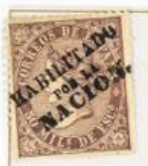
50 Milésimas de Escudo