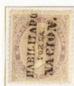
20 Centésimas de Escudo