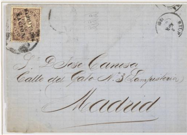
1869 (8 de Abril). Sobrescrito de Bilbao a Madrid (ESPAÑA). Franqueado con 50 milésimas para un porte . El sello lleva la sobreimpresión "Habilitado por la Nación". Matasellos Circulo de Bilbao (Nº22 en Matasellos Españoles de Pedro Monje). En el frente, fechador de Bilbao y al dorso, el de llegada.