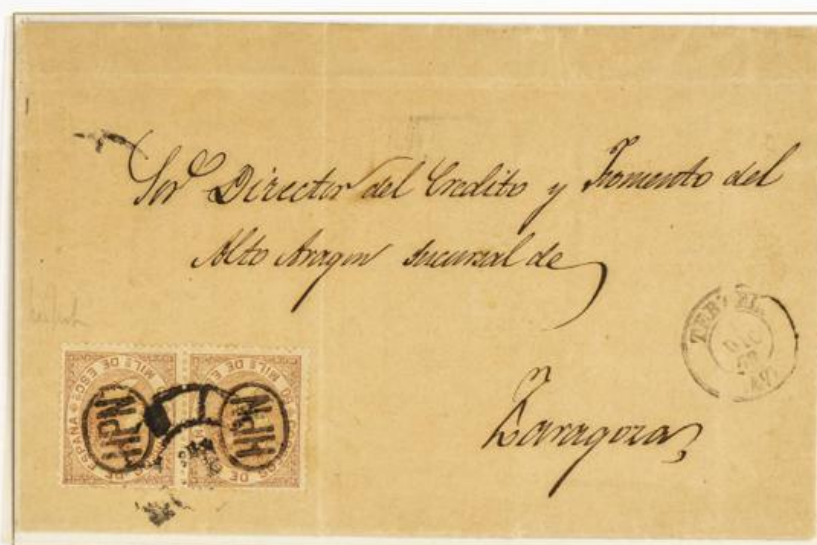
1868 (Diciembre, 1). Teruel a Zaragoza. Franqueo de 50 milésimas, pareja con sobrecarga HPN, dentro de un óvalo, usado en Teruel, para un doble porte . Matasellos Rueda de Carreta "47" de Teruel.