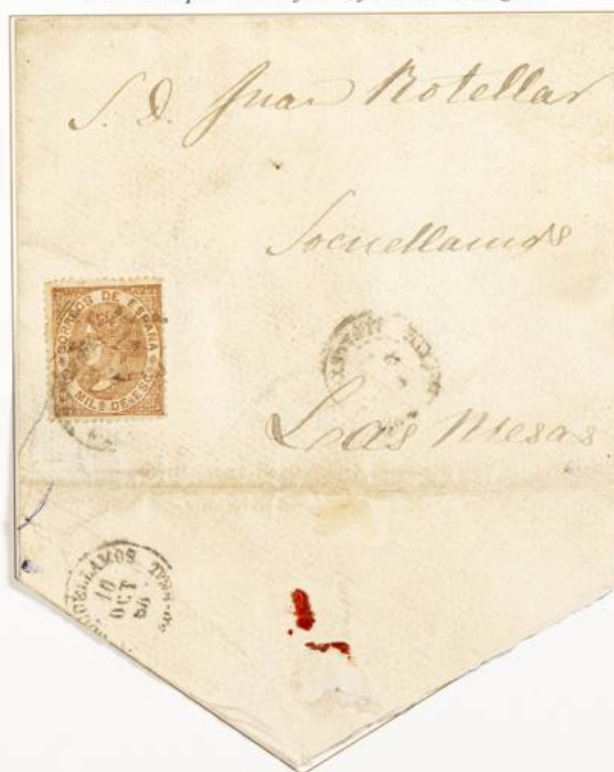
1868 (9 de Octubre). Frontal de carta con parte del reverso de Villarobledo a Socuellanos (ESPAÑA). Franqueado con un sello de 50 milésimas, para un porte. Matasellos fechador. El sello lleva la habilitación manuscrita "Habilitado por la Nación". En el frente, el fechador de origen y, al dorso, el de llegada (10-Oct-1868).