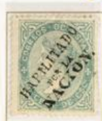
10 Centésimas de Escudo