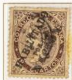
19 Cuartos castaño. Habilitados por la Nación. Matasellos fechador.