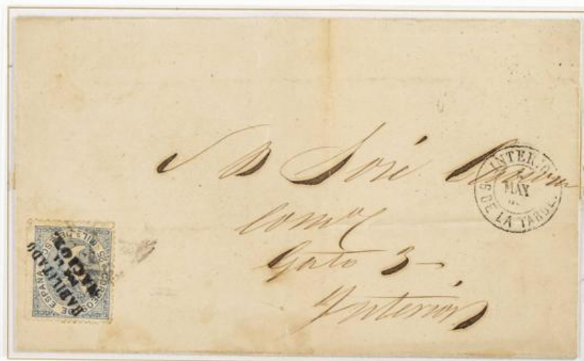
1869 (5 de Mayo). Sobrescrito de Madrid INTERIOR . Franqueado con un sello de 25 Milésimas de Escudo para un porte . El sello lleva la sobreimpresión "HABILITADO POR LA NACIÓN". Matasellos de fecha. En el frente hay el fechador "INTERIOR/6 DE LA TARDE"