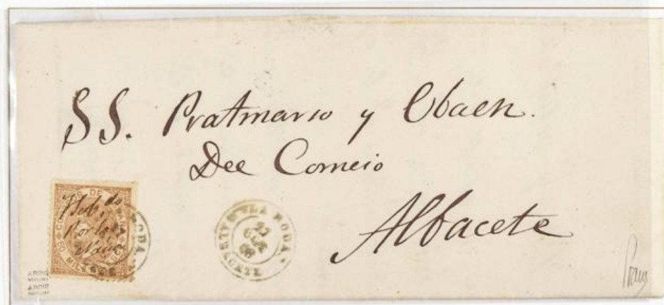
1868 (27 de Octubre). Sobrescrito de La Roda a Albacete (ESPAÑA). Franqueada con un sello de 50 Milésimas de Escudo (Emisión de Julio de 1867), para un porte . El sello lleva manuserita la frase "Habdo Por la Nación". Matasellos fechador LA RODA/ALBACETE, que se repite en el frente. Al dorso, el fechador de llegada.