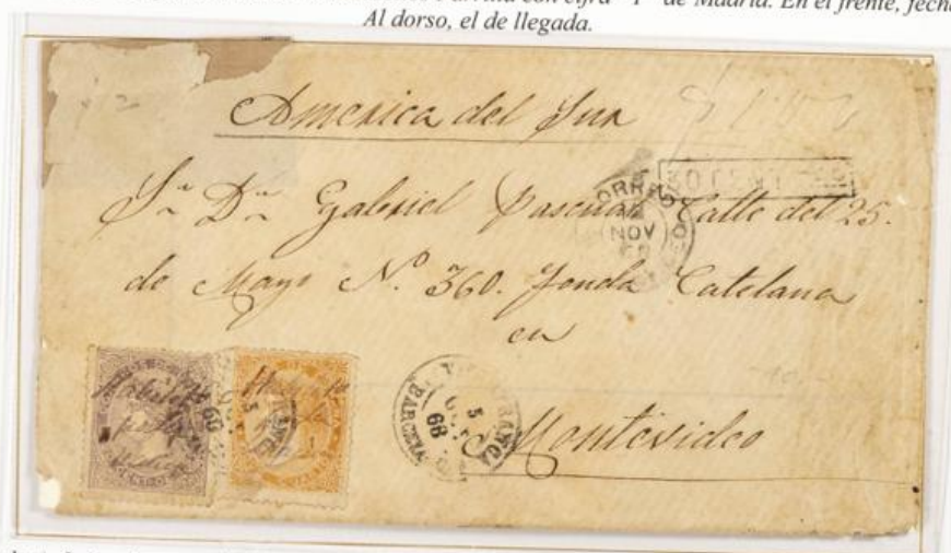
1868 (5 de Octubre). Sobre de carta de Villafranca a Montevideo (URUGUAY). Franqueado con 20 Centésimas y 12 Cuartos, para un porte . Los sellos llevan "Habilitado por la Nación". Matasellos fechador de Villafranca. En el frente, se repite el fechador junto al de llegada a Montevideo y tasa de "30 céntimos" (dentro de un rectángulo) para cubrir el porte en el interior de Uruguay.