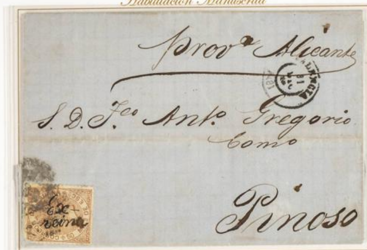
1868 (31 de Diciembre). Sobrescrito de Valencia a Pineoso (ESPAÑA). Franqueado con un sello de 50 milésimas, para un porte. Matasellos Parrilla con cifra "8" de Valencia. El sello lleva la manuscrito "Ex reina", curiosa mención antimonárquica. En el frente, fechador de origen.

Isabel II Habilitados por la Nación Habilitación Manuscrita