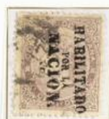
20 Cts de E