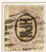
20 Centésimas de Escudo Matasellos Parrilla