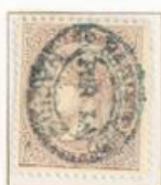
20 Centésimas de Escudo