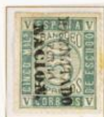
5 Milésimas de Escudo