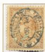
50 milésimas de Escudo