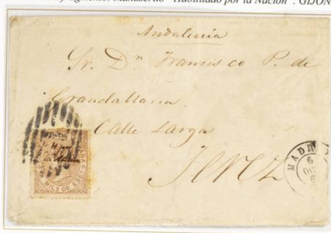
1868 (6 de Octubre). Sobre de carta de Madrid a Jerez (ESPAÑA). Franqueado con 50 milésimas para un porte . El sello lleva manuscrito "H. por la Nación". Matasellos Parrilla con cifra "1" de Madrid. En el frente, fechador de origen. Al dorso, el de llegada.