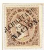
100 Milésimas de Escudo