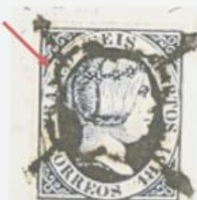
Rotura del óvalo sobre la C de FRANCO.