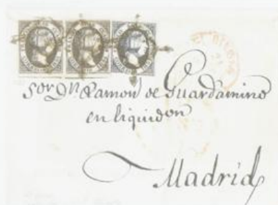
Fallo de estampación en FR de FRANCO.