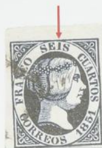
Estampación deficiente de la I de SEIS y múltiples puntos blancos en el fondo negro del ovalo de la imagen.