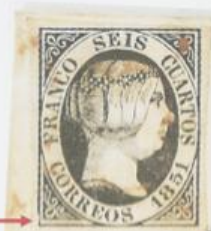
Fallo del marco en la esquina inferior izquierda.