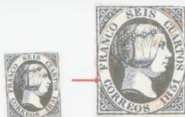
Mancha negra en la C de CORREOS.