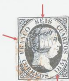
Lunar blanco sobre la cabeza. Deficiente estampación de AN de FRANCO y I de 1851.