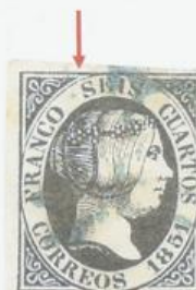
Rotura del óvalo sobre la S de SEIS.