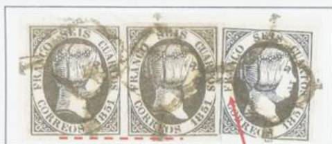
Defecto estampación en EO de CORREOS.