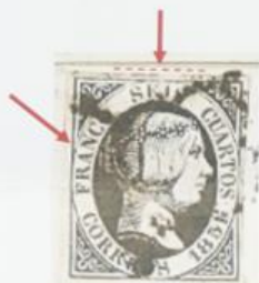
Rotura del óvalo sobre AN de FRANCO y fallo de estampación en SEIS.