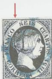
Adorno superior izquierdo prolongado.