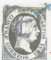
Rotura del marco exterior a la altura de 1851.