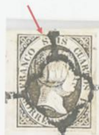
Rotura del óvalo sobre la S de SEIS.