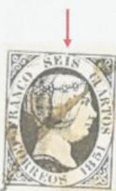
Rotura del óvalo sobre la I de SEIS.