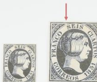
Rotura del óvalo sobre SEIS.