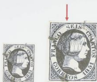
Variante en la 1ª S de SEIS, deformada.