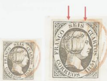
Rotura del óvalo sobre los dos 6.