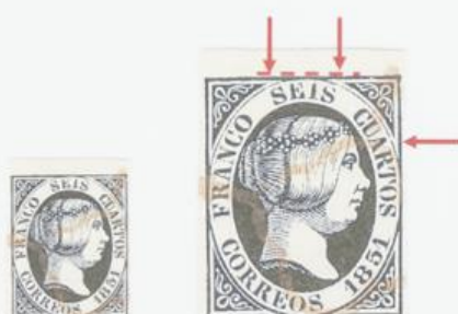
Estampación defectuosa de SEIS y varias roturas del óvalo.