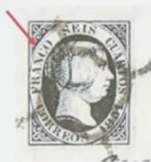
Rotura de la C de FRANCO.