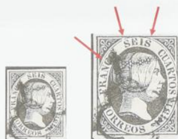
Roturas del óvalo en la parte superior.