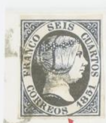
S de CORREOS rota.