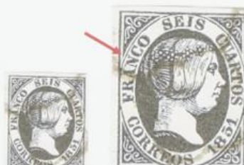
Rotura del óvalo sobre N de FRANCO.