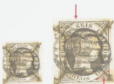
Rotura del óvalo sobre la S de Seis. Estampación deficiente de 1851.