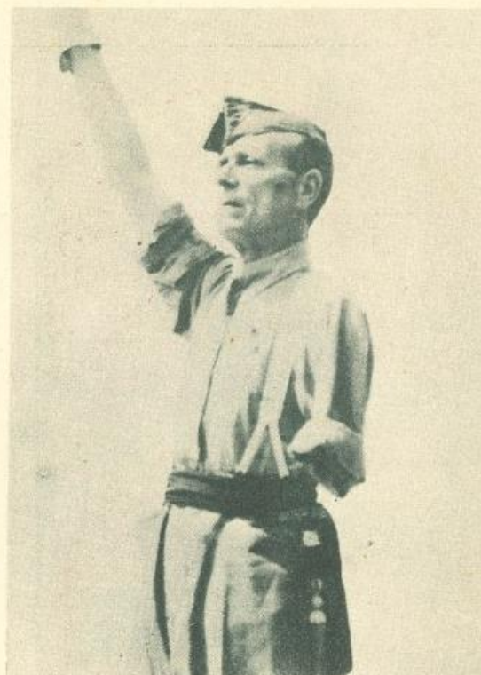
Excmo. Sr. General D. José Millán Astray, Fundador de la Legión y mutilado de guerra.