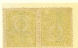
TETE BECHE nº A 005,323 COLOR: FALIDO