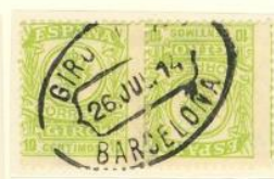
TETE BECHE nº A 045,427 EN AMBOS SELLOS Y EN LA MISMA DIRECCION.