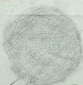
SELLO SECO Nº 2 ESCUDO CON CORONA REAL.