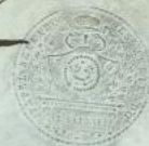
SELLO SECO Nº 1 PAPEL SELLADO EN ARRIENDO.