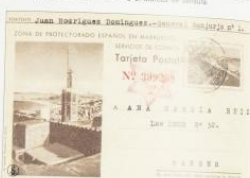
1943. 31 agosto. Tetuán a Tánger. Marco de censura marroquí