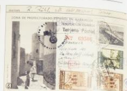
1942. 3 abril. Tetuán a Múlnheim. Franquet 5 c. + 5 c. + 10 c. Marcas de cancela