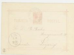
1884. 13 noviembre. Pinar del Río a Leipzig