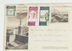
1906. 25 abril. Nador a Bruselas. Franquet 10 c. + 30 c. + 30 c. + 25 c. + 70 c.