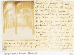
1896. Cádiz a Dresde, Alemania. Fotografía adherida de Garzón, Núm. 512, de la Asamblea de Granada.