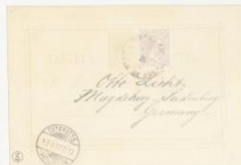
1882. 13 octubre. Matanzas a Magdeburg, Alemania. Franquet 2 ct. castaño violeta