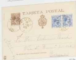
1895. 7 febrero. San Roque, Cádiz, a Roma Escribo 5 c. + 5 c. azul. Peñón