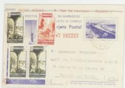
1943. 19 marzo. Tánger a Valencia. Franquet 10 c. + 10 c. + 10 c. + 10 c.