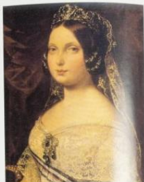
Isabel II en 1846. Federico Medrano - Palacio de Navarra

Isabel II inclinó sistemáticamente sus preferencias políticas hacia los moderados, incumpliendo su papel arbitral de reina constitucional al llamar a formar gobierno siempre al mismo partido, lo cual llevó a los progresistas a recurrir a la fuerza para tener opción de gobernar; por esa razón se sucedieron los pronunciamientos, mecanismo de insurrección militar frecuentemente combinada con algaradas populares, para forzar un cambio político.