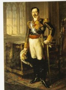
General Ramón María Narváez Vicente López - Museo de Bellas Artes de Valencia

El descontento de los liberales acabó por provocar una revolución que dio paso a un «Bienio Progresista» (1854-56), marcado de nuevo por la influencia de Espartero. Pero una nueva sublevación militar restableció la situación conservadora, abriendo un periodo de alternancia entre los moderados de Narváez y un tercer partido de corte centrista liderado por el general O'Donnell, nacido en Santa Cruz de Tenerife. Los progresistas, excluidos del poder, se inclinaron otra vez por la vía insurreccional, que prepararon desde el Pacto de Ostende de 1866; pero esta vez exigieron el destronamiento de Isabel, a la que acusaban de intervencionismo partidista y de deslealtad hacia la voluntad nacional.