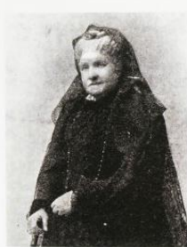
Isabel II en la época del exilio

El resultado fue la Revolución de 1868, que obligó a Isabel II (de vacaciones en Guipúzcoa) a exiliarse en Francia. En 1870 abdicó en su hijo Alfonso y confió a Cánovas la defensa en España de la causa de la restauración dinástica; esta se logró tras el fracaso de los sucesivos regímenes políticos del Sexenio Revolucionario (1868-74), y la entronización de Alfonso XII. La reina madre, símbolo del pasado y del desprestigio de los Borbones, regresó a España en 1876, severamente vigilada y bajo la prohibición de cualquier actividad política; pero sus desavenencias con el gobierno de Cánovas le decidieron a exiliarse definitivamente en París, donde permaneció resentida y aislada, sobreviviendo a su madre (1878), su hijo (1885), su marido (1902) y la mayor parte de sus amantes y amigos.