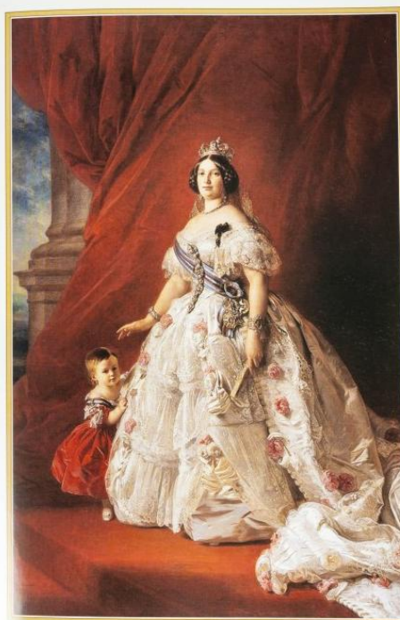
ISABEL II de Borbón - Reina de España

Luis Alemany Indarte Real Academia Hispánica de Filatelia