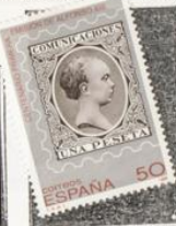
Sello de Alfonso XIII de 1889.

1989.-Centenario de la 1ª emisión de Alfonso XIII, denominada de "Pelón".