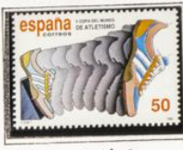
Iniciación de la carrera.

1989.-Centenario de la 1ª emisión de Alfonso XIII, denominada de "Pelón".