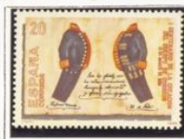
Uniforme de Gala y de diario.

1989.-I Cent. de la creación del Cuerpo de Correos.