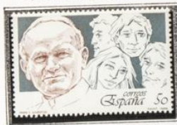
El Papa y grupo de jóvenes.

1989.-Barcelona'92. III Serie Pre-Olimpica.