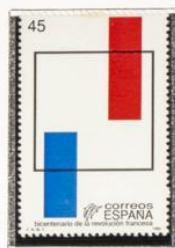
Alegoría del triunfo de la razón y bandera francesa.

1989.-Bicentenario de la Revolución francesa.