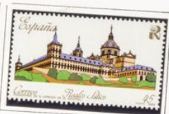
Palacio Real de Aranjuez.