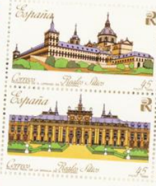
Monasterio de El Escorial. Granja de San Ildefonso.