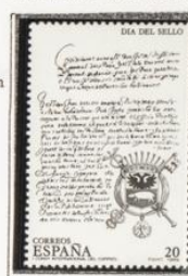
1º Convenio Internacional y escudo