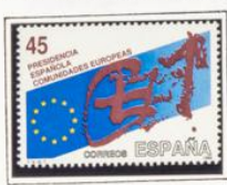
Bablenia, diseño de Tapies.

1989.- Presidencia española de las Comunidades Europeas