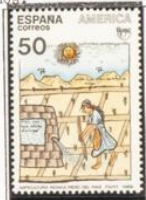
Ilustración del manuscrito: "Nueva crónica y buen gobierno".

1989.-América-UPAE. Pueblos precolombinos.