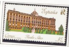
Palacio Real de Madrid.

1990.-Campeonato del Mundo de ciclo-cross Getxo '90