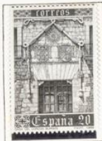
Fachada de la Casa.

1989.- Presidencia española de las Comunidades Europeas