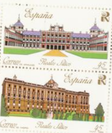
Palacio de Aranjuez. Palacio Real de Madrid.