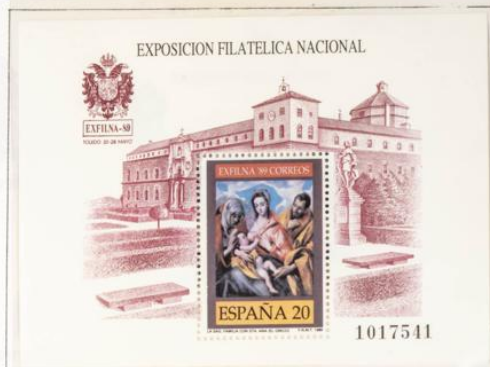
"Sagrada Familia" de El Greco.