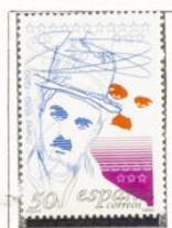
Charlie Chaplin. Charlot.