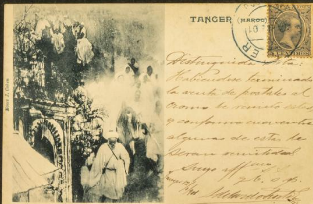
TÁNGER (MARRUECOS).—VISTA TOMADA SOBRE LOS FUERTES