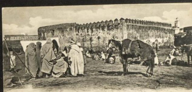
LARACHE (Maroc). - Le Sukko en dehors de la Ville